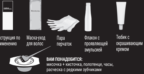
Инструкция по применению